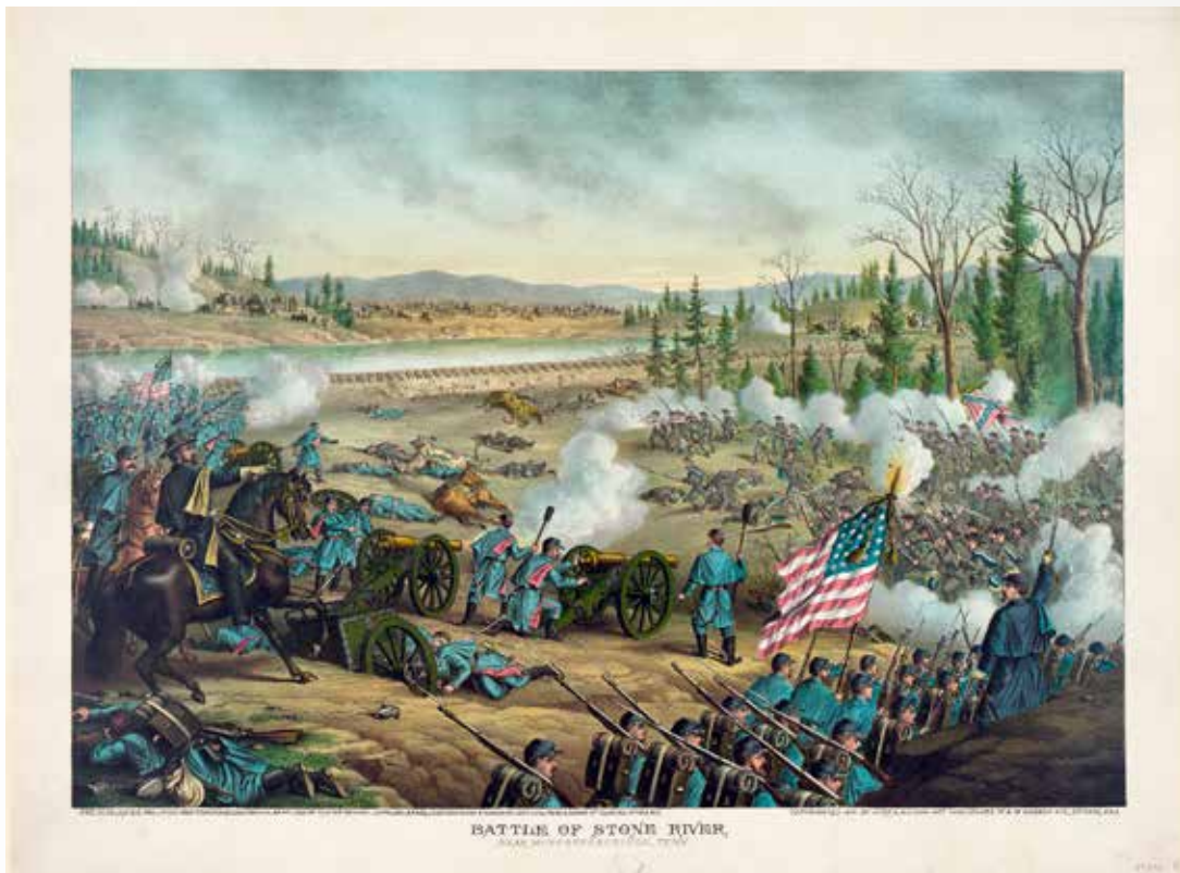
Slaget ved Stones River - general Rosencrans sitt på hesten til venstre i bildet. Her fall det flere nordmenn enn i noko anna slag i den amerikanske borgakrigen.